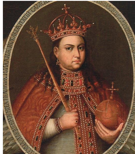
Obrázek 3: carevna regentka Sofie Alexejevna

Pro provedení bylo nutné překonat rozpory mezi Rzeczpospolitou a Moskvou, které pramenily z doby tzv. velké smuty, kdy na určitou dobu došlo k polskému obsazení Moskvy. 45 Šlo o územní vlastnictví Kyjeva a Záporoží, ale důležitou roli hrála také práva pravoslavných obyvatel v oblasti a také v oblasti Ukrajiny a Polska. Další neshody pramenily z rozličného náboženského přesvědčení. Rusové vnímali vyznávání jakékoli jiné víry než pravoslavné za špatné a ve své podstatě kacířské. Docházelo tedy