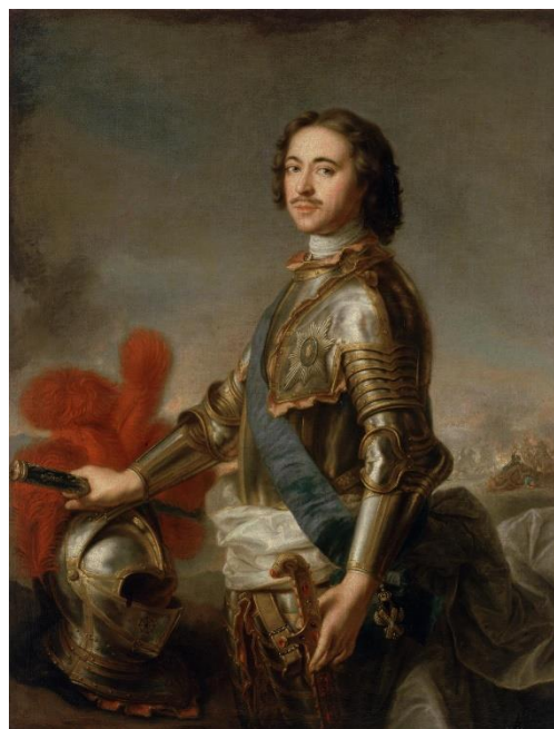
Obrázek 4: car Petr I. Alexejevič

Za doby panování Petra Alexejeviče se stalo prioritou usilování o přístup k Černému moři a černomořské oblasti. Car Petr si sice uvědomoval hrozbu, kterou Krym pro Rusko představoval, ale uklidněn tím, že Osmanská říše spolu s krymskými Tatary věnovala pozornost především Habsburské monarchii a Rzeczospolite, nechal otázku Krymského poloostrova na později a zaměřil se na získání přístavního města Azov. První protiazovské tažení započalo v roce 1695. Bylo ovšem neúspěšné. Petrovy vojenské jednotky město obléhaly po čtyři měsíce, dokud car nerozhodl o návratu. Zpáteční cesta měla ale devastační účinky na většinu ruského vojska a mnoho vojáků zemřelo vyčerpáním. 57