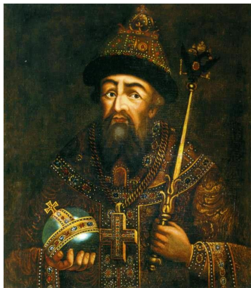
Obrázek 2: car moskevský a vši Rusi Ivan IV. Vasiljevič