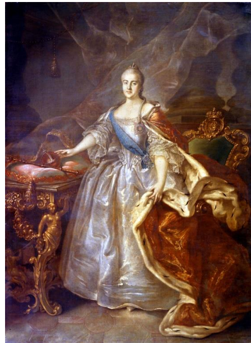
Obrázek 5: carevna Kateřina II. Alexejevna

úspěchy ve válce skončily a při následné ruské odvetě byl poražen. Kateřinin generál Petr Alexandrovič Rumjancev dokázal obsadit Perekopskou šíji a proniknout hluboko na Krym. Carevna byla spokojena, a proto navrhla mírová jednání. Kirim Girej by byl patrně svolný, ale objevil se problém – zemřel. Zvolení jeho nástupce, chána Devleta IV. Gireje (1769 až 1770 a 1775 až 1777), nebylo jednoznačné, došlo k bojům o nástupnictví. Těmito boji byl Krym na nějakou dobu ochromen, čehož Kateřina využila k tomu, aby zahájila na Krymský poloostrov další tažení. Velitelem se stal kníže Vasilij Michajlovič Dolgorukov, který dokázal několikrát porazit Osmany, kteří přišli krymským Tatarům na pomoc, a obsadit Kaffu (dnešní přístavní město Feodosija), čímž